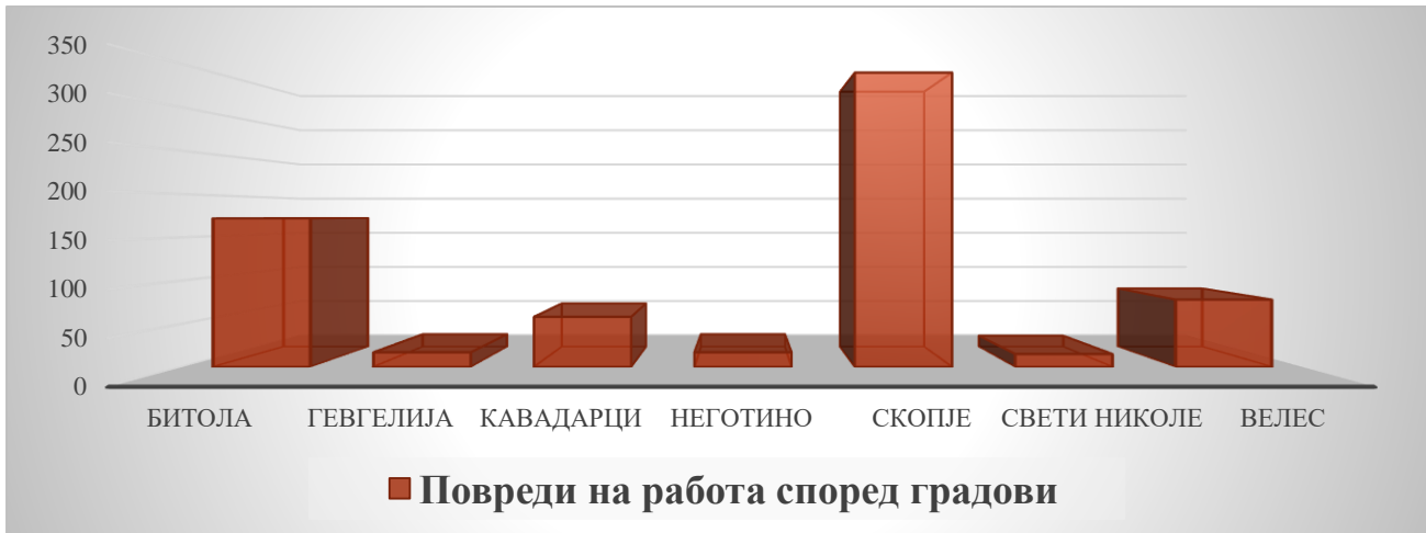
Графикон број 4. ГРАФИЧКИ ПРИКАЗ НА ПОВРЕДИТЕ НА РАБОТА СПОРЕД ГРАД ВО ПЕРИОДОТ ОД 2024 - 2025 ГОДИНА ВО РЕПУБЛИКА СЕВЕРНА МАКЕДОНИЈА