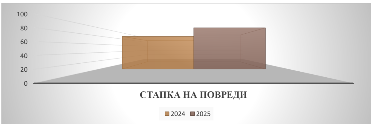
Графикон број 3. ГРАФИЧКИ ПРИКАЗ НА СТАПКА НА ПОВРЕДИ НА РАБОТА НА 100.000 ВРАБОТЕНИ ВО ПЕРИОДОТ ОД 2024 - 2025 ГОДИНА ВО РЕПУБЛИКА СЕВЕРНА МАКЕДОНИЈА

Во структурата на вкупниот број на повреди на работа во 2025 година според град најголем број на повредени работници се регистрирани во Скопје вкупно 340 т.е 49.0%, што во однос на претходната година постои зголемување на бројот на регистрирани повреди за 15.0%.